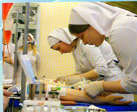
Конкурсантки проводят забор крови на анализ