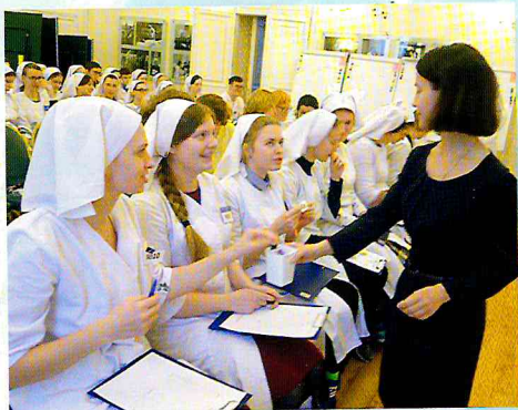
Перед началом состязания прошла жеребьевка